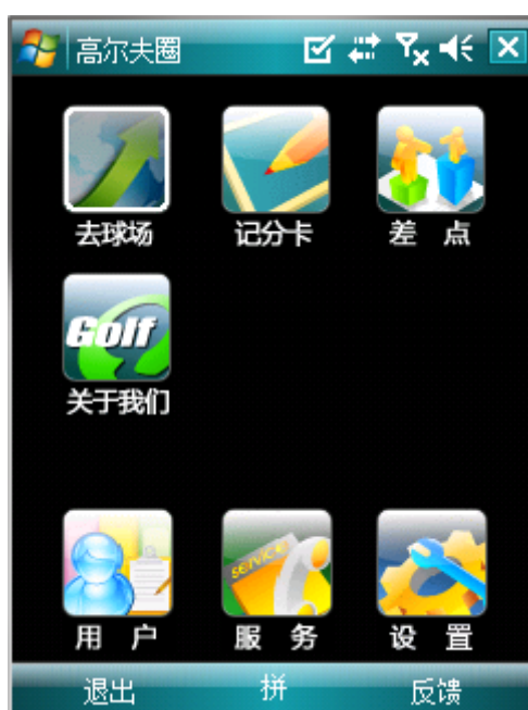
(图 1) 高尔夫圈智能终端主界面

高尔夫圈智能终端产品主要提供以下四个功能: ①找球场, ②电子记分卡, ③定位与测距, ④差点系统